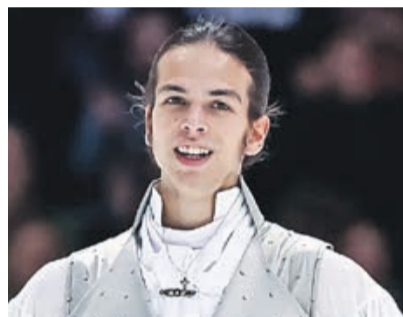
Петр Гуменник — фигурное катание

В Милане Филиппов, родившийся на Камчатке, едет в статусе 23-кратного чемпиона России и серебряного призера чемпионата мира-2025 в категории до 23 лет. В середине января на Кубке мира во французском Куршевеле 23-летний россиянин занял третье место в спринте (олимпийской дистанции) — это его первая медаль в соревнованиях подобного уровня.